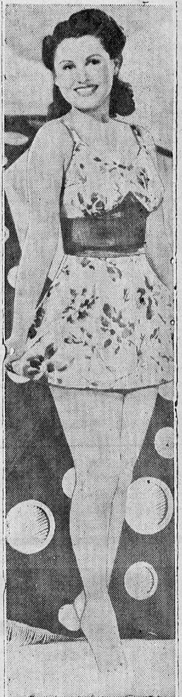
¡QUE BUENO ESTA EL DOMINO!